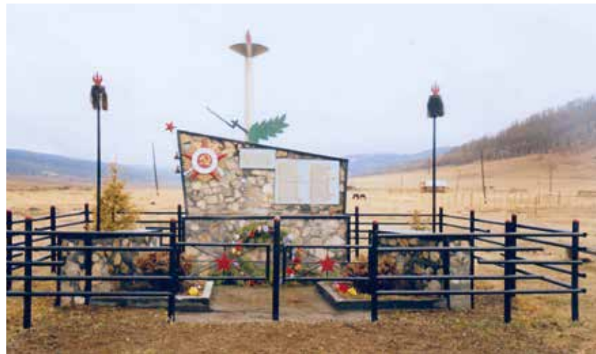
Памятник погибшим, 9.05.2005 г.