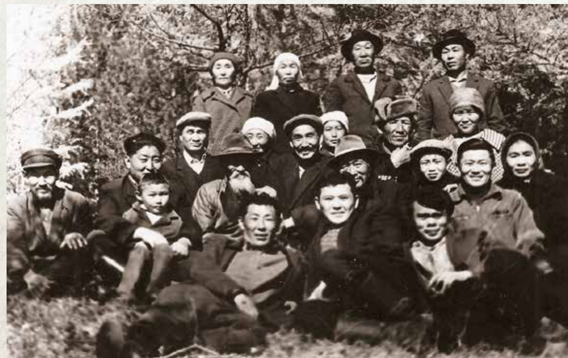
Дархинтуйцы, 1965 г.